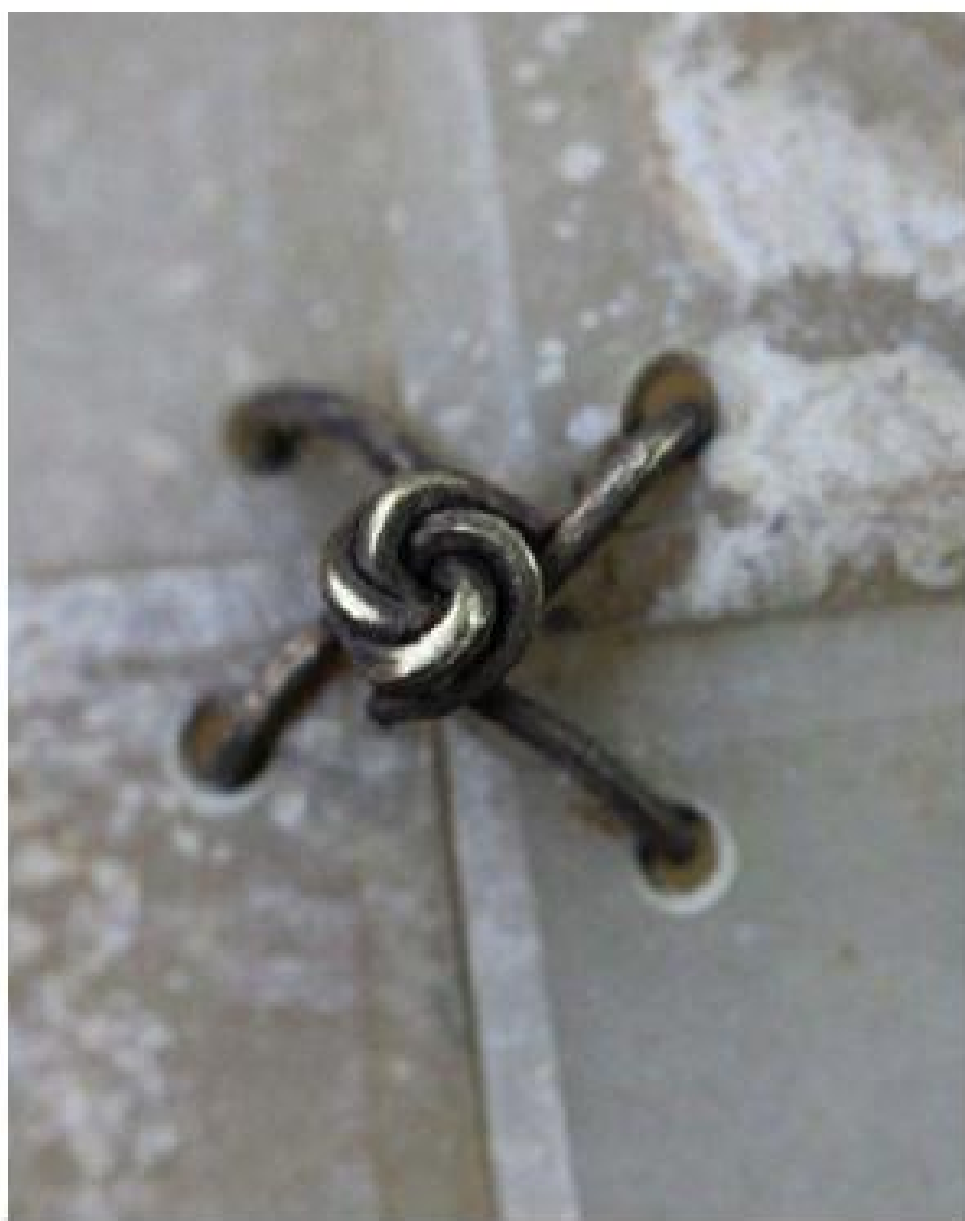
盘绕式打结(玉衣正面)