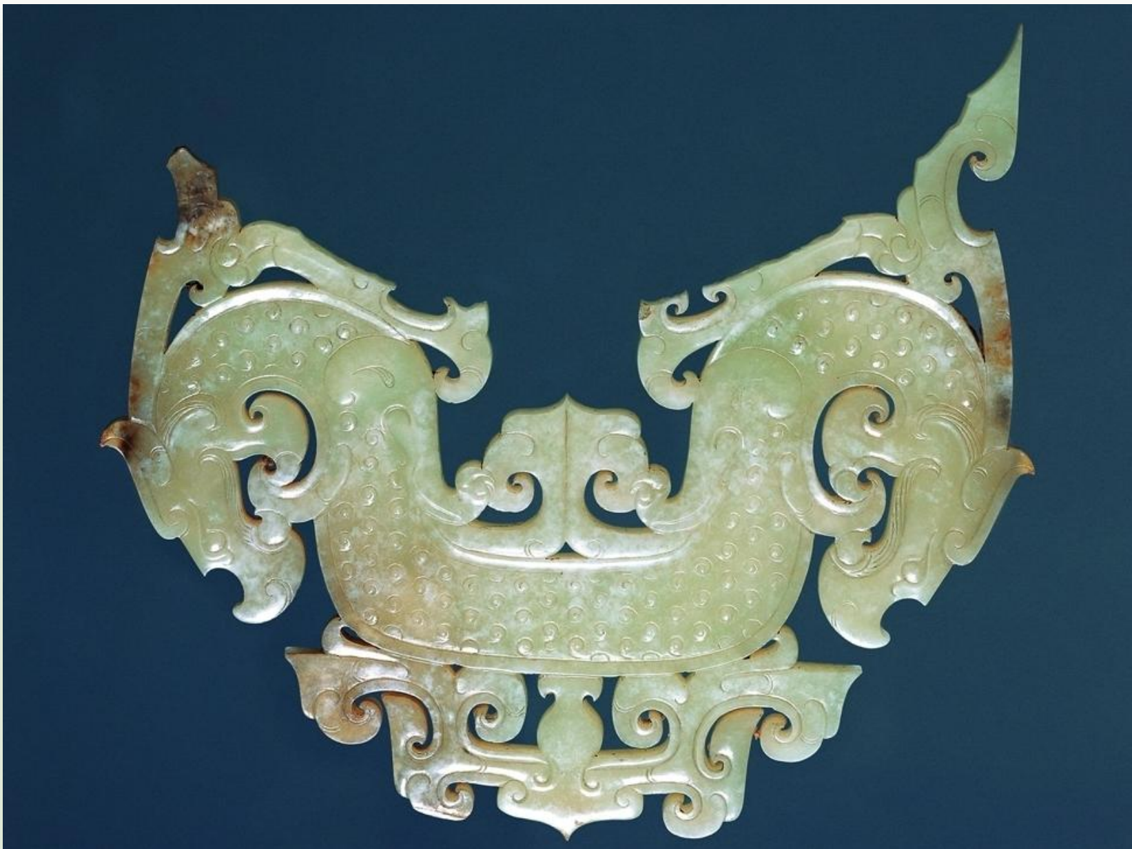
玉面饰：狮子山楚王墓