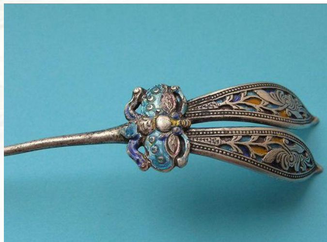
《中国古代首饰配饰》

烧蓝 ，是我国传统的首饰工艺之一。烧蓝是将整个胎体填满色釉后，再拿到炉温大约800摄氏度的高炉中烘烤，色釉由砂粒状固体熔化为液体，冷却后成为固着在胎体上的绚丽的色釉，此时色釉低于铜丝高度，所以得再填一次色釉，再经烧结，一般要连续四五次，直至将纹样内填到与掐丝纹相平。