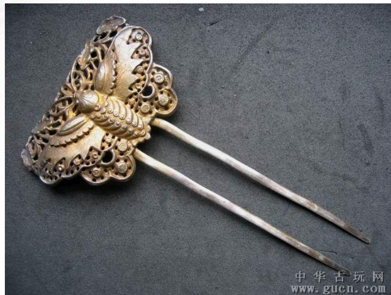
银镏金大蝴蝶双股发钗·清代

钗： 约出现在西汉晚期，在发簪的基础上发展而来。钗和簪最大的区别就是钗是两股的，钗的首端为珠翠和金银合制成花朵或其他造型，常配备成对，使用时安插在双鬓。