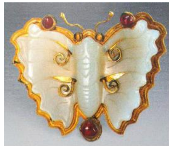
金簪（朱察卿家族墓出土）