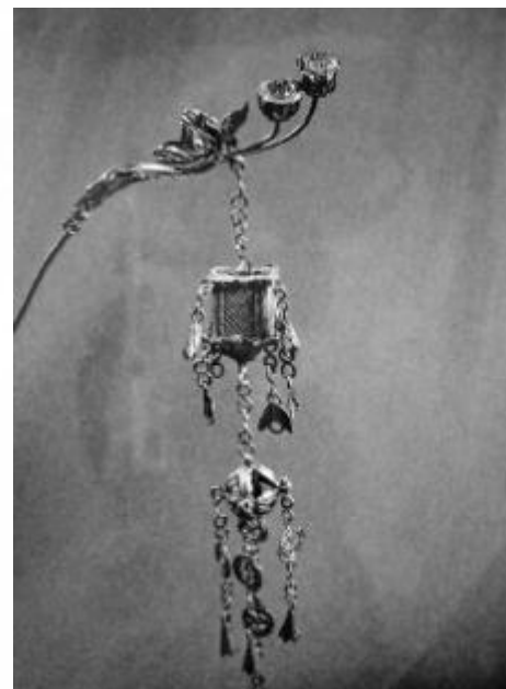
银如意形莲花莲蓬坠香囊步摇·清代

步摇： 步摇起源于先秦时期，而明确的概念则见于两汉时期。步摇是在簪、钗上多接了一串坠饰，因走动时摇曳而得名。根据《释名 释首饰》：“步摇，上有垂珠，步则摇也。”