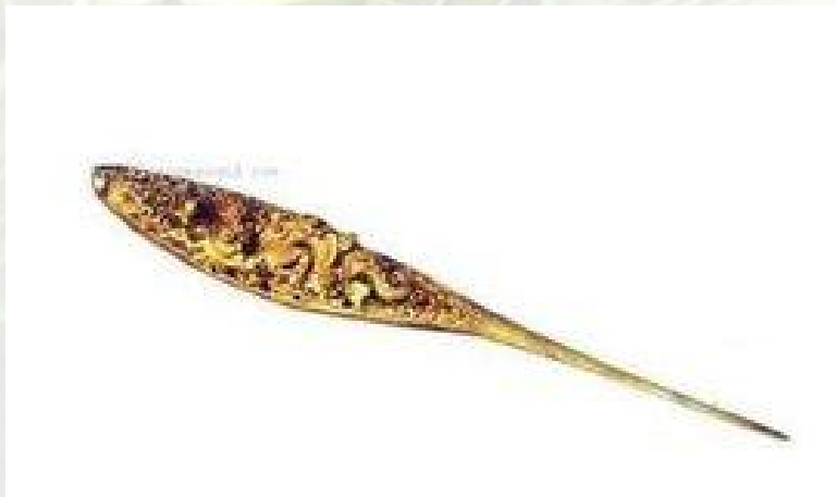
南宋鎏金龙纹银簪 (现藏永嘉县文化馆)