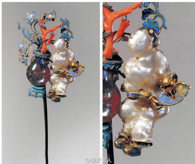
“童子报平安”簪（珍宝馆）