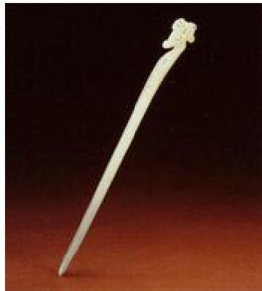
玉笄·河姆渡遗址出土

笄： 笄是发簪的前身。古代汉族女子用以装饰发耳的一种簪子，用来插住挽起的头发，或插住帽子。笄是我国在新石器时代就有的，骨笄、蚌笄、玉笄、铜笄等用来固定发髻。周代男女都用笄，笄的用途除固定发髻外，可固定冠帽。