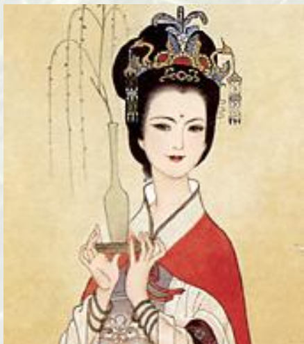
凤簪（工笔画 文成公主）