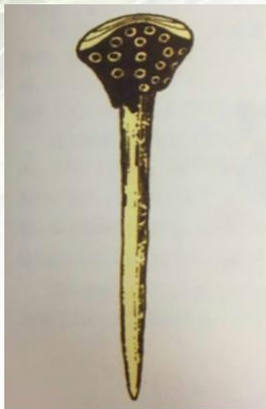
胶粘骨簪 甘肃永昌鸳鸯池出土

最早出现在仰韶文化中，最早用的材质多为石头、动物骨骼、木质及某些玉石。发簪的样式比较简单，有的在簪身上刻一些横、竖、斜纹，有的将簪头刻成球形、环形、丁字形及一些不规则形状。新石器时代晚期的发簪从工艺技术上到造型艺术上都已与商周时期十分接近。