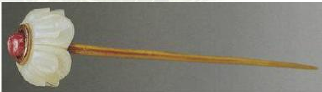
莲花金簪（定陵出土）

明代发簪按照材质可分为金簪、银簪、玉簪、象牙簪、骨簪等等，其中以金簪和银簪最为常见，样式最为丰富。流行在簪首镶嵌宝石以做装饰，运用焊接、掐丝、镶嵌等多种工艺使簪首扩大。