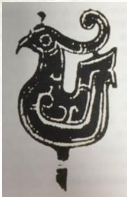
凤头骨簪 河南安阳出土

商周时期，青铜被大量应用，制玉工具得到优化，技术和材质都有发展。人们不仅以发簪饰发，还使用双股的发簪装饰头发。簪的头部出现了人形及各种鸟兽形状。河南安阳殷墟妇好墓出土了一批形式各异的骨簪，共计499件，通常在12.5-14厘米。其中一件簪头饰为凤头形状，是当时的精品。