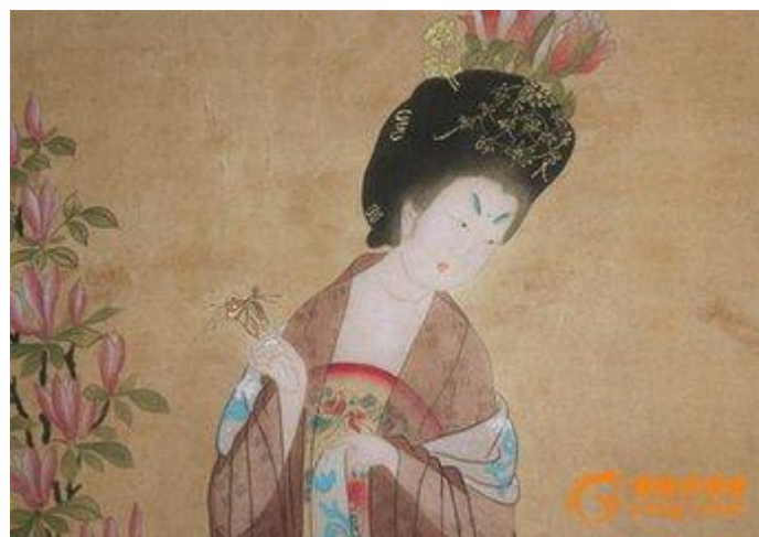
仕女簪花图（唐 周昉）

隋唐以后，金银簪十分流行，做工也极为精细，常以花草、龙凤形为饰。唐末时期及以后，是发簪流行的盛世，金银发簪也十分流行，可以说，各民族的发簪形制、款式、插戴方式等均定型于此，唐代敦煌壁画的众多妇女就是插满花簪的形象。