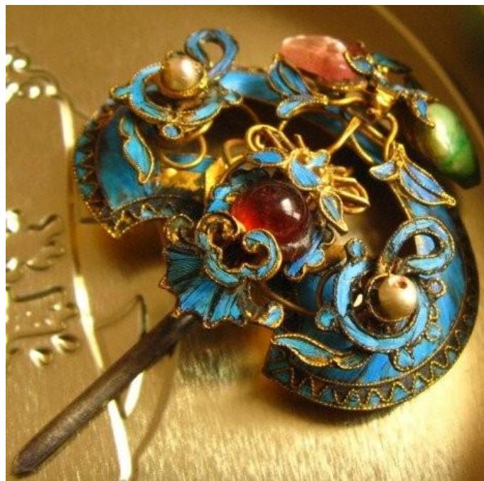
《中国古代首饰配饰》

点翠 是我国传统的金属工艺和羽毛工艺的完美结合，先用金或镏金的金属做成不同图案的底座，再把翠鸟背部亮丽的土耳其蓝色的羽毛仔细地镶嵌在座上，以制成各种首饰器物。