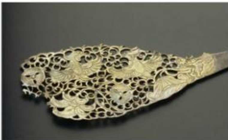
鸳鸯莲纹鎏金银花簪 (《唐宋文化对首饰的影响》)