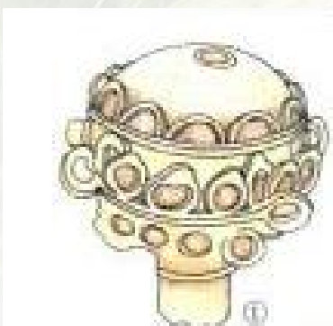
球形金簪首 江苏宜兴晋墓出土

该时期铁质工具得到改进，玉石雕刻技术发展，簪的纹饰更加繁复，纹饰由抽象变为写实，有云纹等几何纹、龙凤纹等动物纹饰、莲花等植物纹饰。金属簪开始流行，但形制一般还都比较简单，魏晋南北朝时期的簪还有玉簪、翡翠簪、玳瑁簪、犀簪等等。这一时期还流行多股式发簪。动荡的魏晋时期，人们还把簪首做成各种兵器的样子，认为它有辟邪的作用。