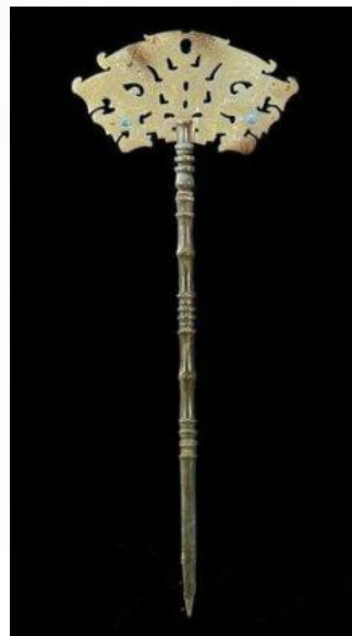
龙山文化玉簪 山东朱封出土